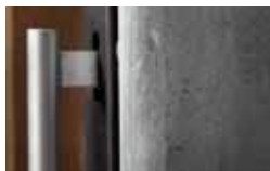
Het handvat blijft altijd koel zodat u de kachel op elk moment kunt openen