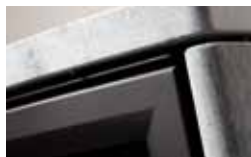
Ook leverbaar met een speksteen bovenplaat of speksteenmantel zodat u langer kunt genieten van de warmte