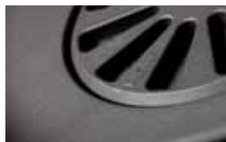
Het schudrooster is van gietijzer waardoor de stookruimte eenvoudig is te reinigen